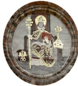
Pave Lucius. Kirkens skytshelgen